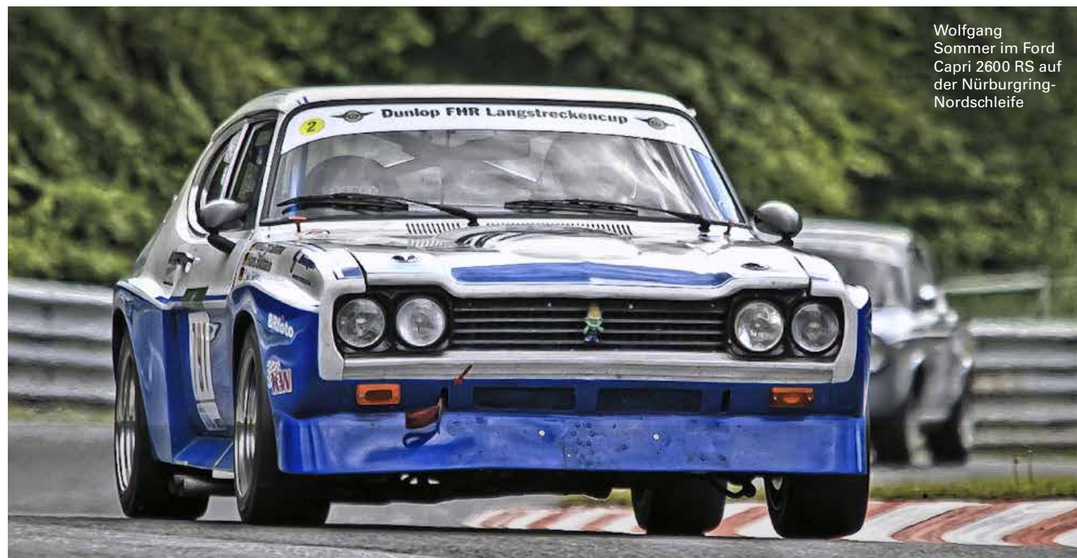
Wolfgang Sommer im Ford Capri 2600 RS auf der Nürburgring-Nordschleife