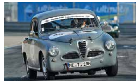
Tourenwagen willkommen: AGDT