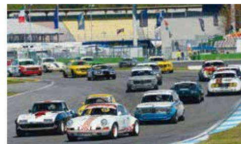
International dabei: HTGT mit FIA-Prädikat

In der Saison 2016 erhält die älteste deutsche historische Rennserie wieder den internationalen FIA-Status. Neben dem Rennen im belgischen Spa-Francorchamps tritt die beliebte Serie auch auf der legendären Rennstrecke hinter dem Strand von Zandvoort an. Eine Teilnahme mit GT, Touren- und Rennsportwagen von 1947 bis 1971 ist mit einer Internationalen Fahrerlizenz der Stufe C oder einer Internationalen historischen Lizenz möglich.