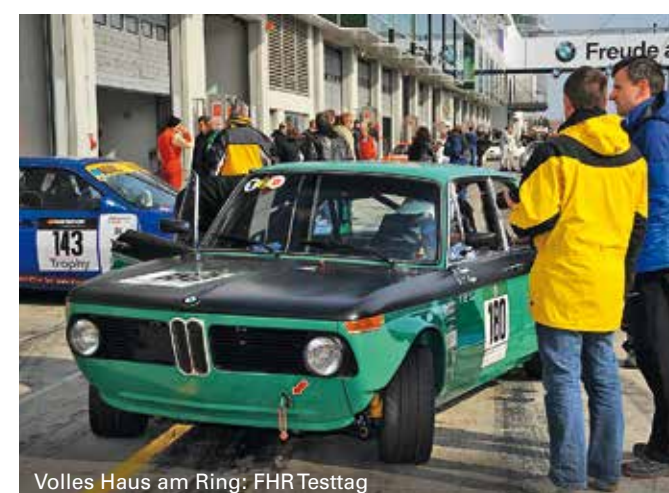
Volles Haus am Ring: FHR Testtag

Am 20. März findet auf dem Grand-Prix-Kurs des Nürburgrings der FHR-Test- und Einstelltag 2016 statt. Zugelassen sind historische GT, Touren- und Rennsportwagen mit einem gültigen Wagenpass oder Straßenzulassung (keine 06er-Kennzeichen). Die Fahrer müssen das 18. Lebensjahr vollendet haben und im Besitz eines Führerscheins oder einer Rennlizenz sein. Ein Helm ist obligatorisch. Anmeldeformulare gibt es auf der Homepage der FHR ( fhr-online.de ), der YoungtimerTrophy oder der FHR-Rennserien.