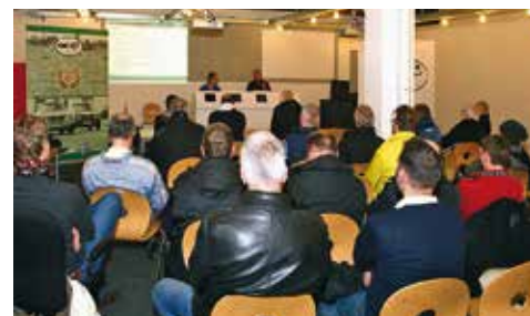
Die Macher erklären sich den Mitgliedern

Zeitgleich zum FHR-Test- und Einstelltag lädt der Vorstand die Mitglieder zur Hauptversammlung ins Fahrerlager des Nürburgrings ein. Schriftliche Einladungen werden Mitte Februar postalisch versendet. Anträge können an die FHR-Geschäftsstelle gesendet werden: FHR-Geschäftsstelle, Hugenottenstraße 100, 61381 Friedrichsdorf, Fax (+49) 61 72/285 91-11 oder info@fhr-online.de